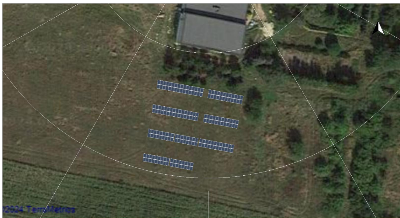
Ilustracja: Zrzut ekranu02