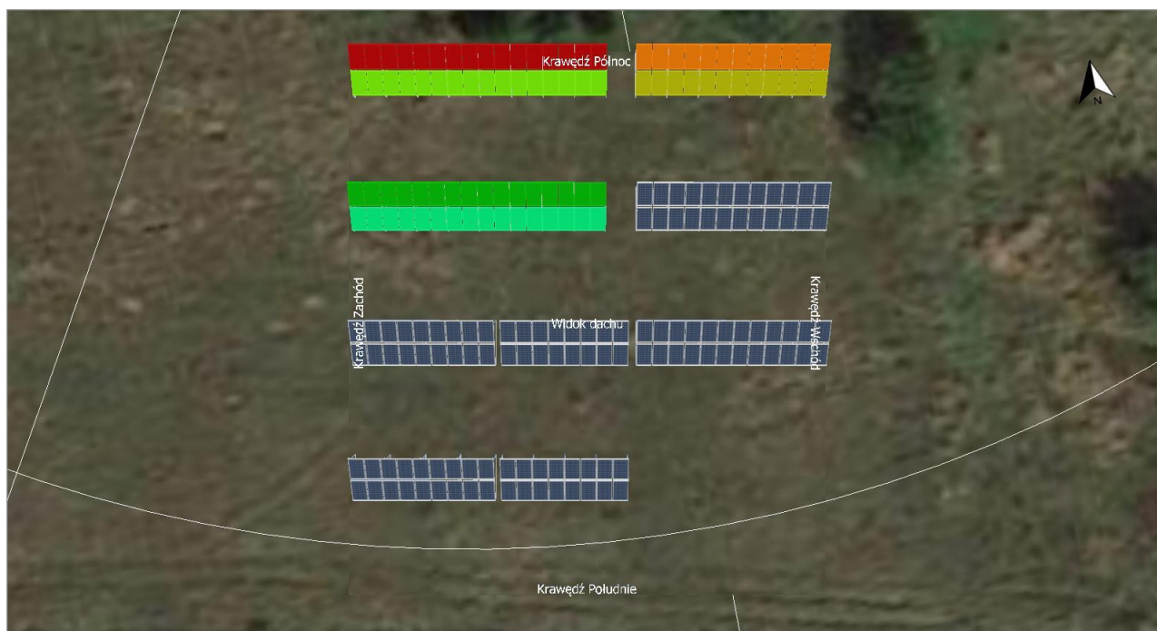
Ilustracja: Zrzut ekranu03