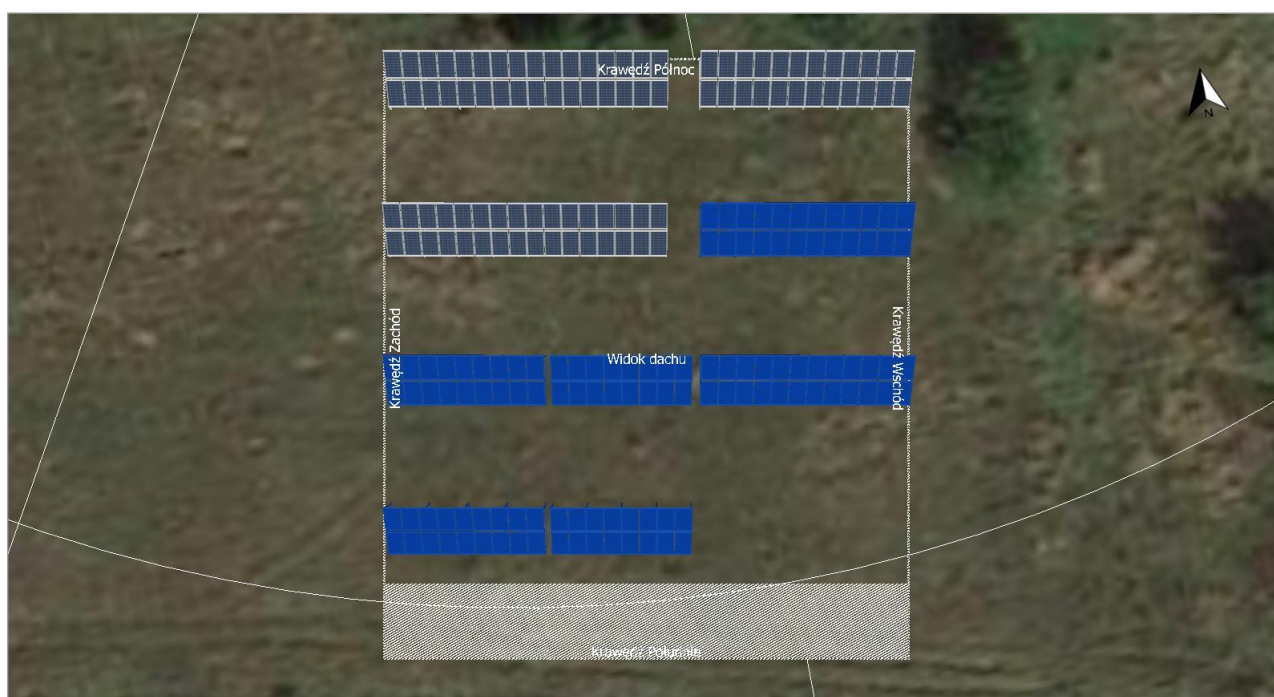
Ilustracja: Zrzut ekranu01